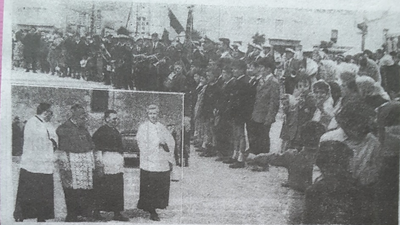
VIX. — Devant la foule massée sur la place de l'Eglise, Mgr Cazaux se rend à la Maison de retraite.

Vix était en fête, dimanche, pour accueillir Mgr Cazaux venu dans la paroisse afin de bénir la Maison de retraite appelée « Maison Saint Joseph » et dont nous avons parlé à différentes reprises.