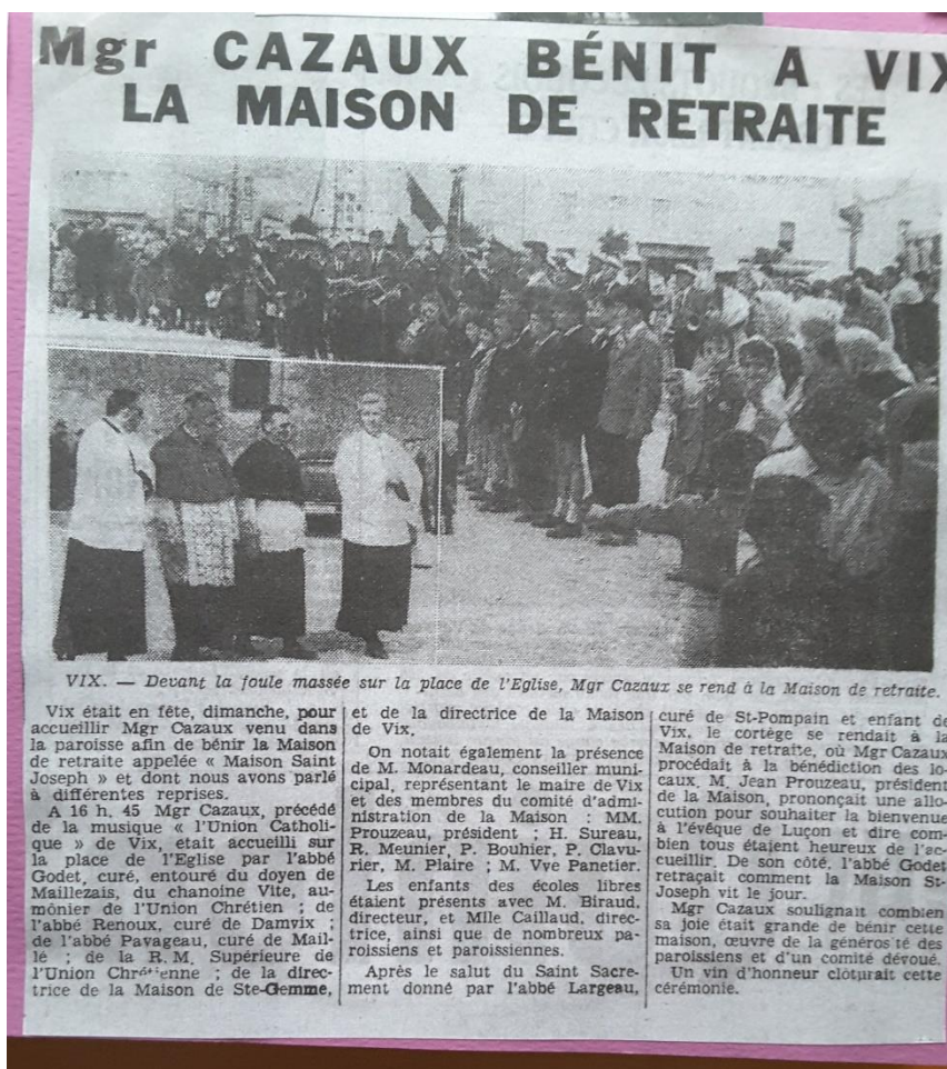
VIX. — Devant la foule massée sur la place de l'Eglise, Mgr Cazaux se rend à la Maison de retraite.

15 novembre 1962 - les premiers pensionnaires sont accueillis. 19 mai 1963 - Bénédiction de la Maison de Retraite par Monseigneur CAZAUX, évêque du diocèse de LUCON