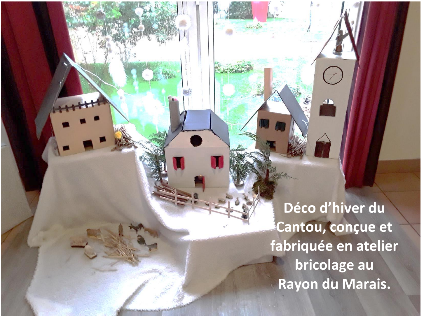
Déco d'hiver du Cantou, conçue et fabriquée en atelier bricolage au Rayon du Marais.